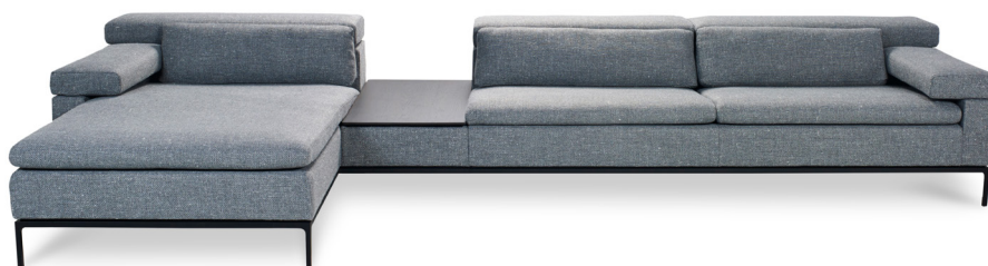
model: SHIVA JR-3960 - design: Jean-Pierre Audebert

Veertig jaar later heeft SHIVA de tand des tijds doorstaan en is het model, mits een aantal lichte design- en comfortingrepen, nog steeds een topper in het JORI-gamma.