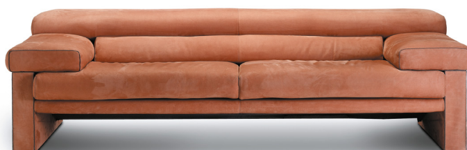
Modell: JR-3900 - Design: Jean-Pierre Audebert

So wurde Audebert vor 40 Jahren von JORI beauftragt, die ersten Linien eines trendigen und nüchternen Sofas zu Papier zu bringen, das den Markt durch sein schlichtes, ruhespendendes Design und seine extrem niedrige Rückenlehne überraschte. Obwohl sein Entwurf erst 10 Jahre später wirklich kommerziell umgesetzt wurde, waren Audebert und JORI mit diesem Modell dem Markt deutlich voraus, wobei das neuartige Design JORI sofort maßgeblich beeinflusste.