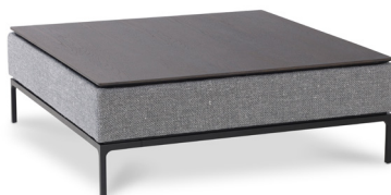
Tisch SHIVA JR-t396