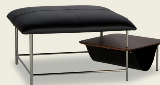
Table-pouf Gipsy : Gipsy est une table-pouf disponible avec une surface de cuir tressé de haute qualité, ou de cuir végétal lisse ou encore de nombreux autres cuirs JORI à surface lisse. Le meuble s'intègre parfaitement dans chaque intérieur: c'est un modèle générique compatible avec l'ensemble des collections JORI.

On peut l'utiliser soit comme extension ou tout simplement comme siège. Elle dispose en outre d'une table basse pliante. En option, la poche placée au bas de la table, très pratique pour y ranger des livres ou des journaux. Gipsy est une œuvre gracieuse et conviviale signée par le duo de designers italiens Poggi+Dondoli.