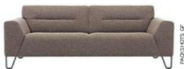
Nevada, stoffen sofa, Durlet , vanaf 3325 euro.