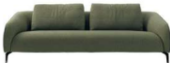
Elias, stoffen sofa, Leolux , vanaf 3395 euro.