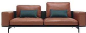
Liv, leren sofa, Rolf Benz , vanaf 8577 euro.