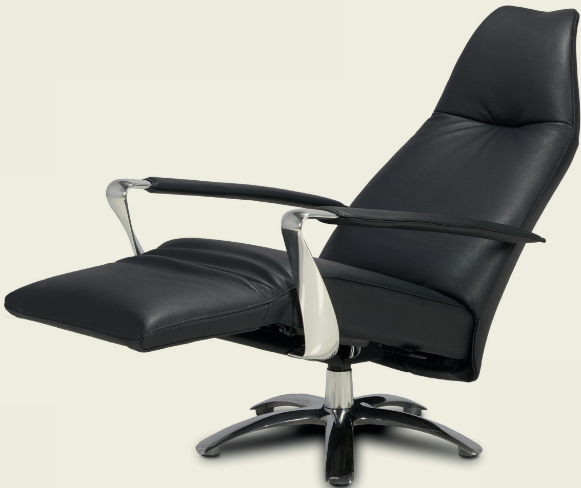
BOLERO Design: Jean-Pierre Audebert