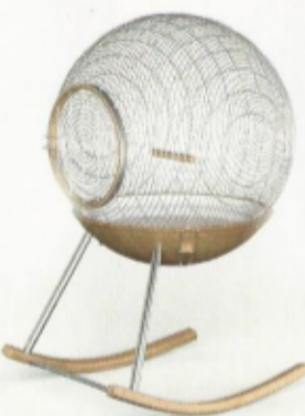
Vogelkooi, Marc Ange. 3.745 euro. www.theinvisiblecollection.com