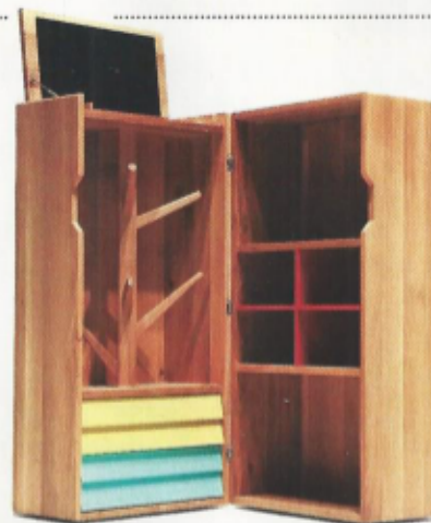
Koffer 'Remix', The Hansen Family. 4.025 euro. www.thehansenfamily.com