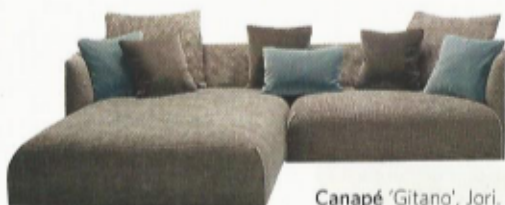
Canapé 'Gitano', Jori. Vanaf 4.600 euro. www.jori.com