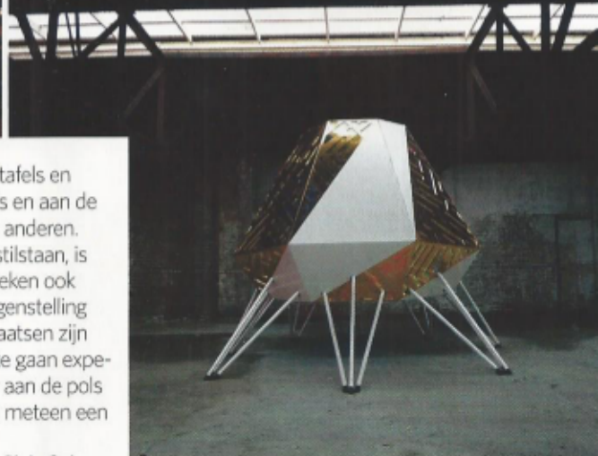
Mobile deejay-booth Mothership, Detroit, 2014.

Bij design denken we aan tafels en stoelen, aan ons eigen huis en aan de prachtige exemplaren van anderen. Maar waar we zelden bij stilstaan, is dat nachtclubs en discotheken ook worden ingericht. En in tegenstelling tot huizen en openbare plaatsen zijn clubs een ideale plek om te gaan experimenteren. Om de vinger aan de pols te houden en om mensen meteen een goed gevoel te geven.