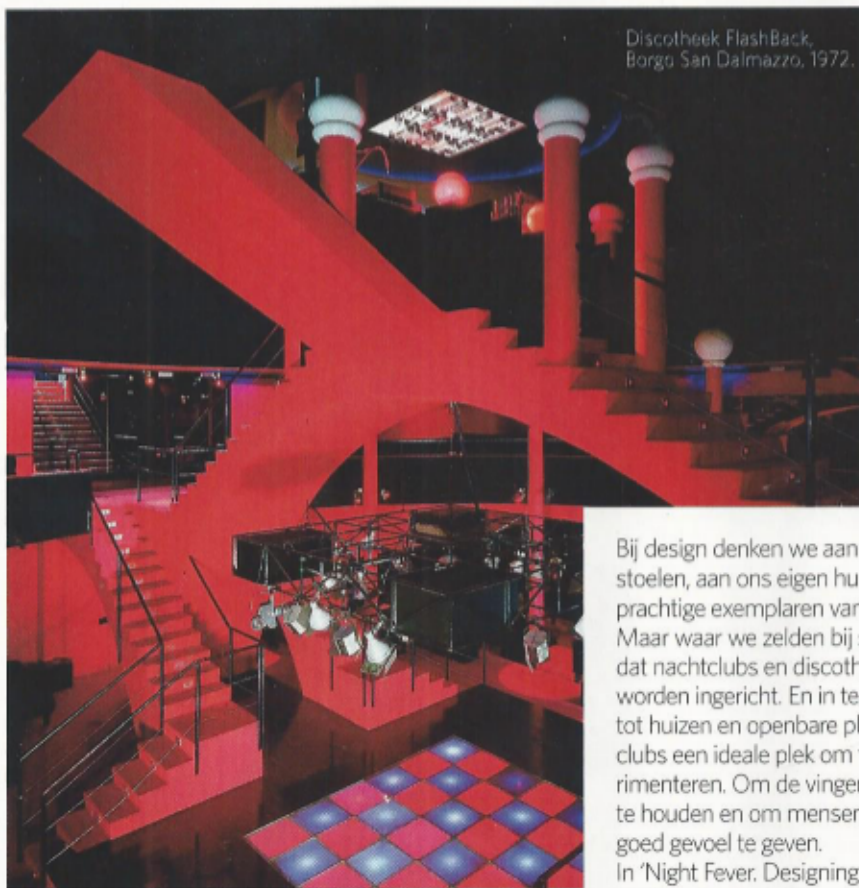
Discotheek FlashBack, Borgo San Dalmazzo, 1972.