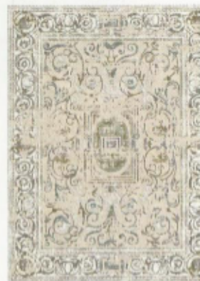
Tapijt 'Richelieu V.1', Illulian. Prijs op aanvraag. www.illulian.com

De afgelopen jaren werden interieurs categoriek ingedeeld in 'strak en minimalistisch' ofwel - totaal tegenovergesteld - 'landelijk, gezellig en vol natuurlijke materialen'. Een kruising tussen die twee stijlen werd zelden een succes. Toch zien we nu een nieuwe vorm van landelijkheid opduiken. Een hip stadsinterieur dat ver weg staat van de steriele loft en aansluit bij een huiselijk en warm plattelandsgevoel. Opgepast: dit is geen gemakkelijke stijl om zelf toe te passen. Maar zeker het proberen waard.