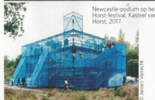
Newcastle-podium op het Horst-festival, Kasteel van Horst, 2017.