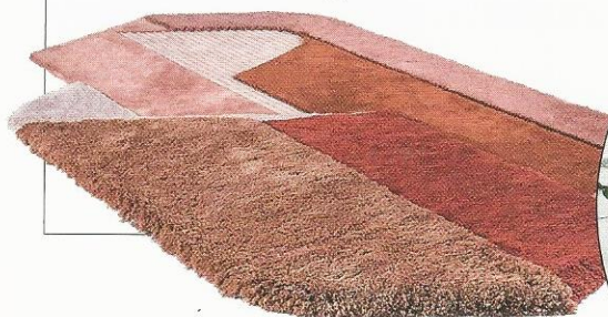
Ontwerp van Josh van Vliet voor Moroso.