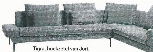
Tigra, hoekzetel van Jori.