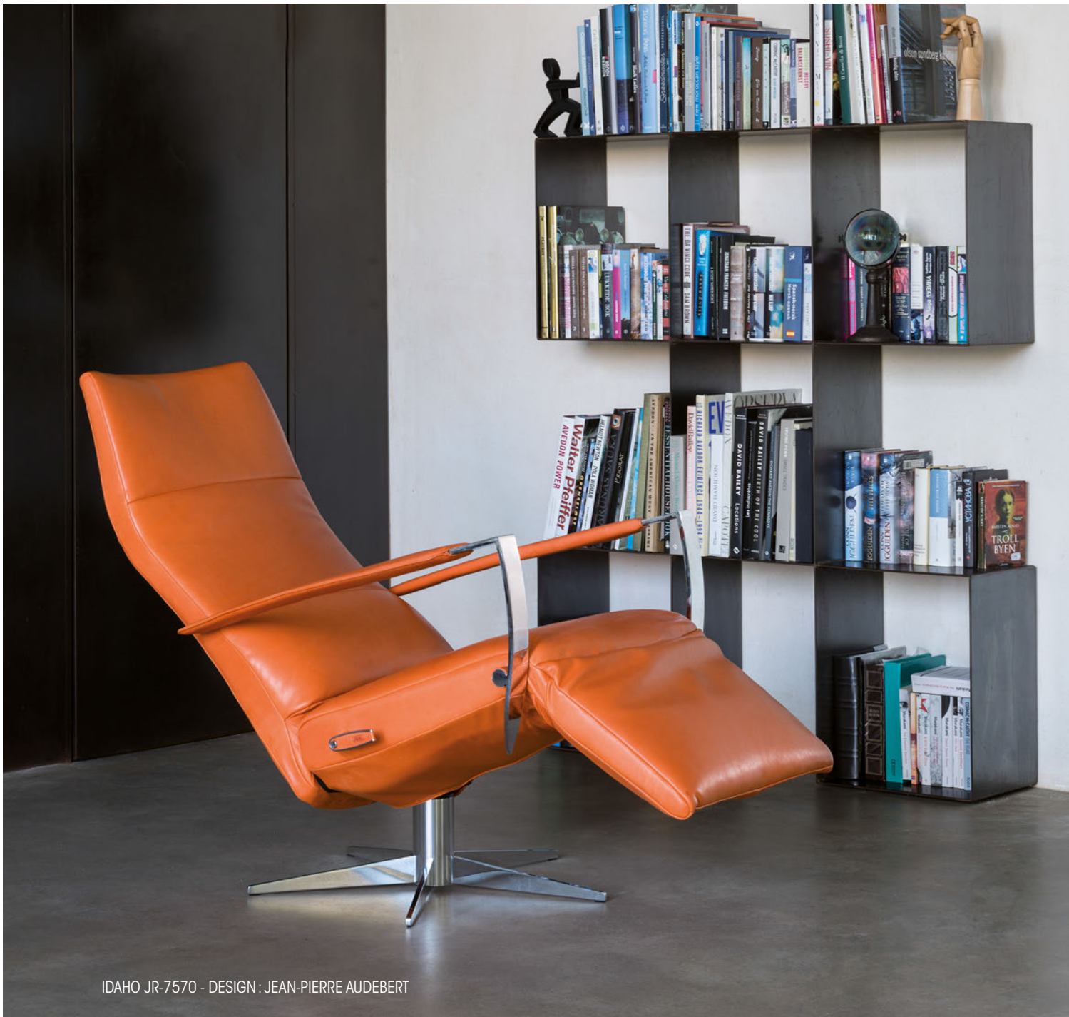
IDAHO JR-7570 - DESIGN : JEAN-PIERRE AUDEBERT